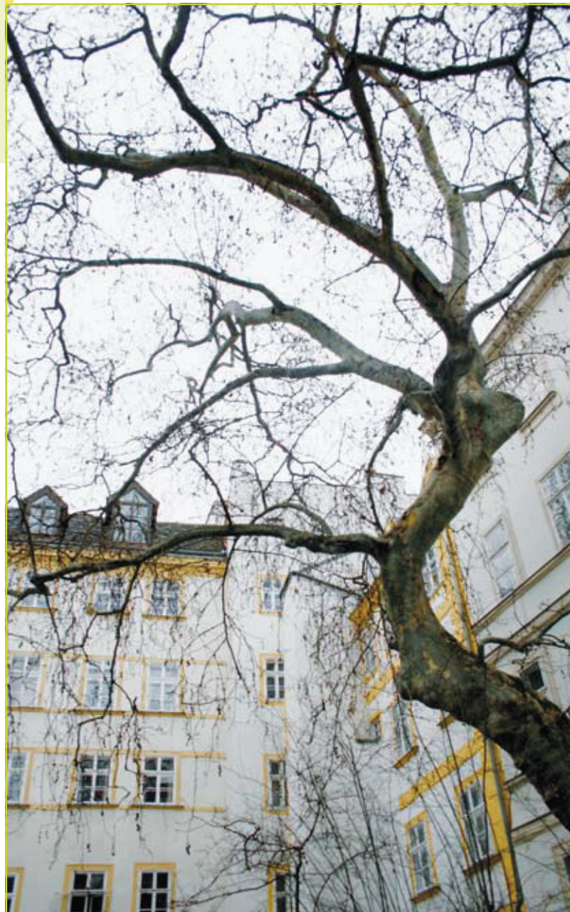
Figuur 1: Bomen in de stad hebben verschillende functies. Ze verbeteren ons fysieke en mentale welzijn door allerlei milieueffecten, bevorderen biodiversiteit in de stad en hebben uiteraard ook vaak een hoge esthetische waarde.