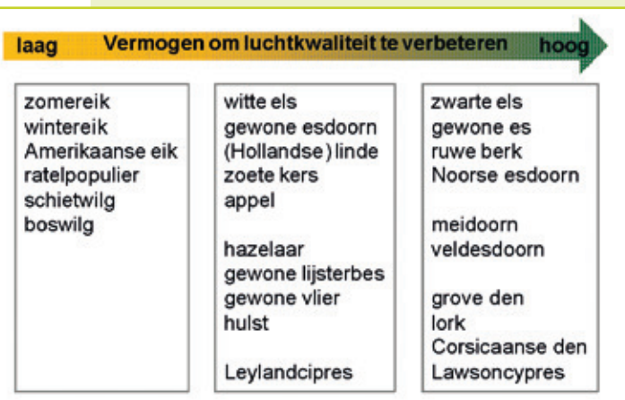
Figuur 4: Rangschikking van boom- en struiksoorten courant voorkomend in stedelijk milieu, naar hun vermogen om luchtkwaliteit te verbeteren op basis van hun capaciteit om polluenten weg te vangen en hun emissie van biogene vluchtige organische stoffen (naar Donovan et al. 2005 en Hewitt 2006)

Het spreekt voor zich dat bomen, en groen in het algemeen, een onmisbare schakel vormen in landelijke, maar zeker ook in stedelijke gebieden waar zij een ecologisch, sociaal, economisch en psychologisch effect hebben met een positieve bijklank voor de menselijke gezondheid vanwege hun luchtfilterende en verkoelende werking. Bepaalde boomsoorten hebben echter een minder prettige kant, met een negatief effect op de luchtkwaliteit of allergische reacties tot gevolg.