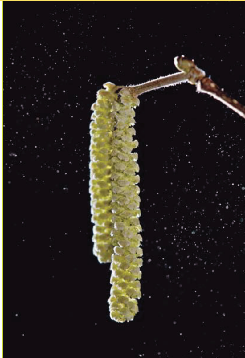
Figuur 3: Verschillende bomen produceren allergene pollenkorrels. De mate waarin ze allergische reacties opwekken verschilt van soort tot soort. Hier zien we een katje van hazelaar in volle actie.

Omwille van de grote verscheidenheid aan BVOS, de manier waarop hun vorming en vrijstelling tot stand komt